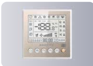
Оptionальный проводной пульт управления KW-86B2