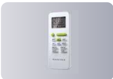
Стандартный беспроводной пульт управления GYKQ-52E