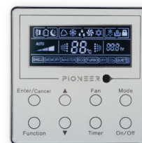
Проводной пульт ДУ в комплекте