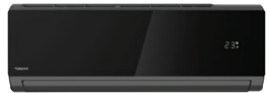
Внутренний блок DA25DVQ1-B